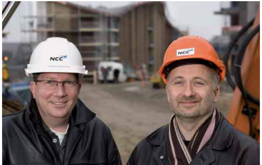
"Det har virkelig været utroligt at se, hvordan parternes brug af den samme CAD-plattform har skabt en helt enestående ensartethed i det digitale grundlag for byggeriet."

"Projektets motto "det, man ikke kan modellere, skal man ikke bygge" har været en smuk tanke, der har fået lov til at præge hele arbejdet med Bispebjerg Bakke. Det kunne rent faktisk lade sig gøre at modellere den specielle tagkonstruktion, men på trods heraf har det krævet helt utraditionel CAD-tænkning at nå til det resultat, vi ser udfolde